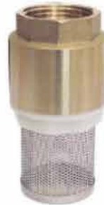
VALVULA C/CANASTILLA DE ACERO INOX 3/4" 153058