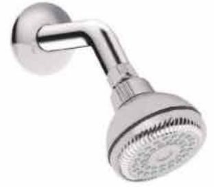
CABEZA D/ DUCHA 1/2" CROMADA GRANDE 126203