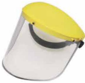
CASQUETE PORTA-VISOR POLIPROPILENO 8"X16" 140162