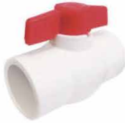
VALVULA ESFERICA PVC DE 2" S/ROSCA 126113