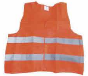
CHALECO DE SEG NARANJA 2 CINT REFLECTIVAS 140280