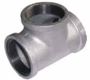
TEE GALVANIZADA 1/2" 126200