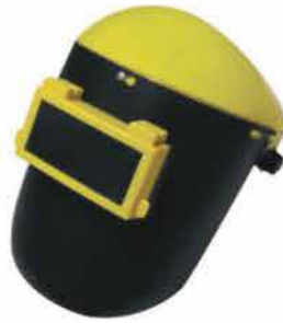
CARETA PARA SOLDAR - CABECERA AMARILLA 140164