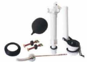
ACCESORIO COMPL P/TANQ BAJO BOY/NEGR PER.METAL C&A 126151