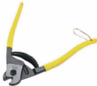
TENAZA CORTA CABLES 8" C&A PRO 140511