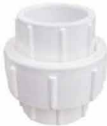
UNION UNIVERSAL DE PVC 1/2" S/ROSCA 126158