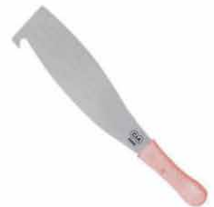
MACHETE CAÑERO M/MAD 14" C/GANCHO 140426